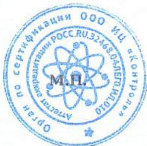
СХЕМА СЕРТИФИКАЦИИ 1с (ГОСТ Р 53603-2020. Оценка соответствия. Схемы сертификации продукции в Российской Федерации).